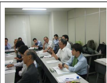
関心が高かったせいか、普段より参加者が多く、質問も次から次へと出てきました。

A 4. 管理がしっかりしている現場にしか納品していないので、あまり聞いておりません。