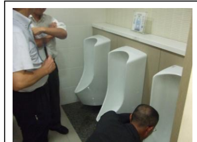
設置現場の見学では、便器を覗き込む人や撮影する人がいました。

《このあと、実際に使用されている現場に見学に行きました。 た。(INAX 銀座ショールーム7階)》