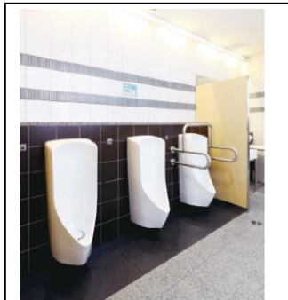
阪急電鉄の摂津市駅トイレ で設置している様子

販売から2年で広がりを見せる半面、無水小便器の課題も分かってきました。例えば家庭での利用は、維持管理の複雑さから、お勧めしておりません。また小中学校では子供たちが誤った清掃をする可能性があるため納入を控えております。また寒冷地ではカートリッジ内部の液体が凍ってしまうことが予想されるので、ヒーターを入れて頂いております。また飲酒を伴う飲食街では、嘔吐による異物購入がシール液等を正常機能させない危険性があるので、カートリッジの交換を余儀なく行うこともあるでしょう。また官公庁の関連施設では清掃業者が入札で毎年変更になる可能性が高いので、年度が替わる度に清掃指導が必要になるかもしれません。しかしコンビニのように、専門の清掃業者ではなく従業員が清掃を行う小規模店舗でも、きちんと維持管理されている現場もありますし、心配だった現場でも案外上手に維持管理できているところもあるので、きちんと説明を行えば大丈夫だという自信が生まれました。