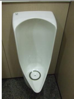
無水小便器の設置された状態。トラップ部分に特殊なカートリッジがあります。

しかし無水小便器は、洗浄時に水を一切使わないトイレであり、尿の流れる下部（トラップ）に、特殊なカートリッジを使用しているのが大きな違いです。便器本体は弊社で作っておりますが、お掃除しやすいよう、凹凸の無いスッキリしたデザインで、表面にはキズ汚れや細菌汚れに強いハイパーセラミック加工を施し、超表面平滑を実現しました。また、水を使わないので水アカもつきません。そして、洗剤をスプレーして拭き取る掃除を原則とし、1日1回は必ず清掃をして頂いております（詳細は後述）。