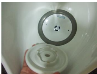
目皿部分を外した状態。中央の穴から青いシール液が出てくると交換のサインとなります。

気になるコスト面ですが、設置時にはセンサーやバルブなどが無く、給水管工事や電気工事も不要なのでイニシャルコストを低減できます。また水道代は洗浄水を使わないため上下水道代が不要で、4L洗浄の小便器と比較すると、約72%が軽減できます（東京の水道料金、カートリッジ7000回の場合）。ただし節水型便器と比較するとコスト減にならない場合もあります（利用人数や規模によりご選択下さい）。なおカートリッジの値段は、6個セットで21000円（税抜）、つまり1個当たり3500円 注1 となります。 注1 ：编者より…定例回開催