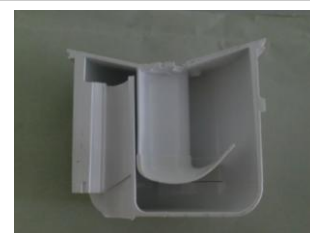
カートリッジ断面図。この中に水とシール液を入れます。尿は下から左側のトラップを通じて配水管に排出されるそうです。

なおカートリッジの使用寿命は5000回～10000回で、使用環境によって左右されます。使用頻度が高いほど尿の入れ替わりが頻繁のために、寿命が長くなる傾向があります。カートリッジの交換は指定の製品をご購入して頂くのですが、マニュアルを参考にすれば誰でも行う事が出来ます。ただし非常に強い臭気が発生します。使用済のカートリッジは、現状ではゴミとして処理していただいております。