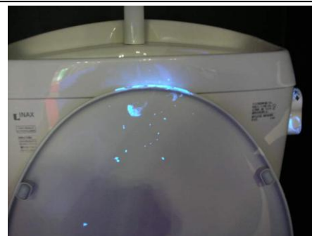
便フタに菌が付着する様子をブラックライトで照らしたところ