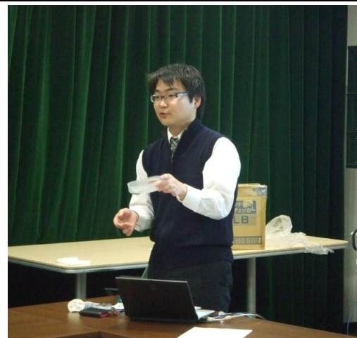
水様便がトイレットペーパーをどのくらい浸透するかの実験（墨汁を垂らします）

トイレの後や嘔吐物・排泄物の除去後には、「洗って、拭いて、消毒・除菌」を“2回”することが予防の上で重要なポイントです。