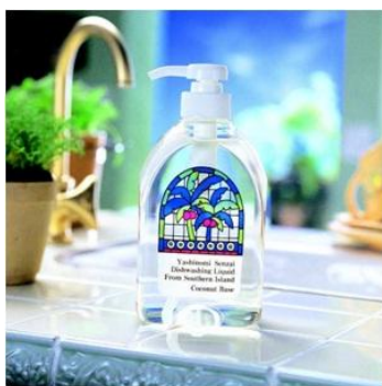
代表的な商品「ヤシノミ洗剤」